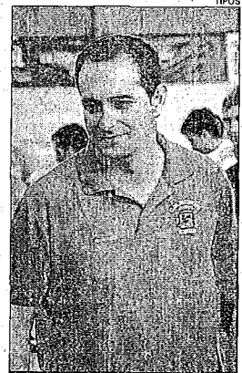
El Almoradí de Nolasco juega en Irún

Por otra parte, hoy sábado, a partir de las diez de la mañana, en el Pabellón Municipal Venancio Costa de Almoradí se van a disputar diferentes partidos de los equipos de las categorías inferiores del Club Balonmano Almoradí. A las 10 de la mañana empezará a jugar el conjunto juvenil masculi-