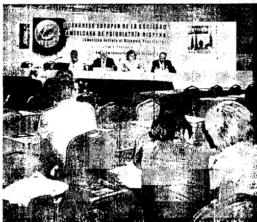
UNA DE LAS MESAS REDONDAS CELEBRADAS AYER. P.A.

—Sí, probablemente, y uno de los objetivos de este congreso es pre-